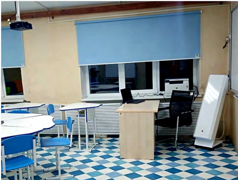
Рабочее место учителя

Зона отдыха снабжена удобными переносными пуфами https://youtu.be/yuaupGJJ30w